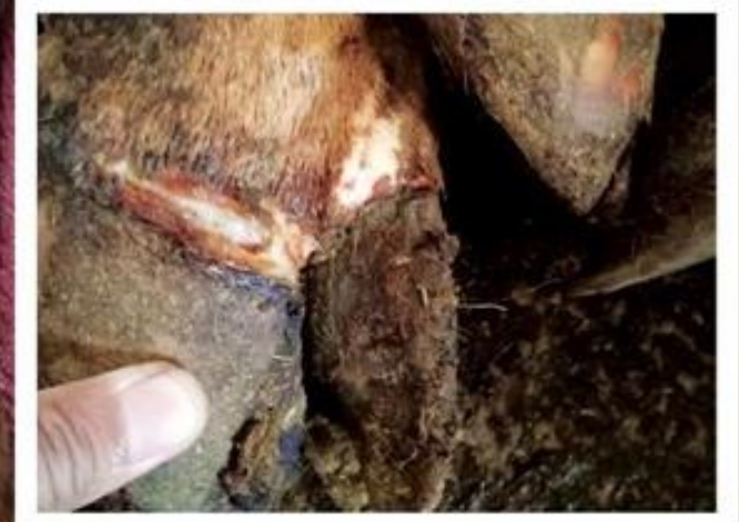
Luka pada Kuku dan kukunya lepas