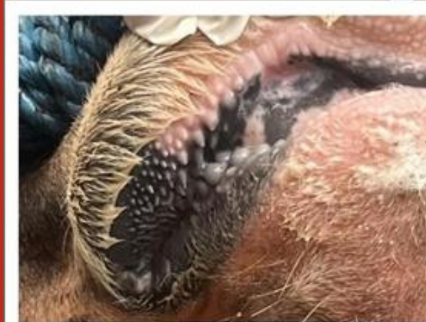
Lepuh pada mukosa mulut