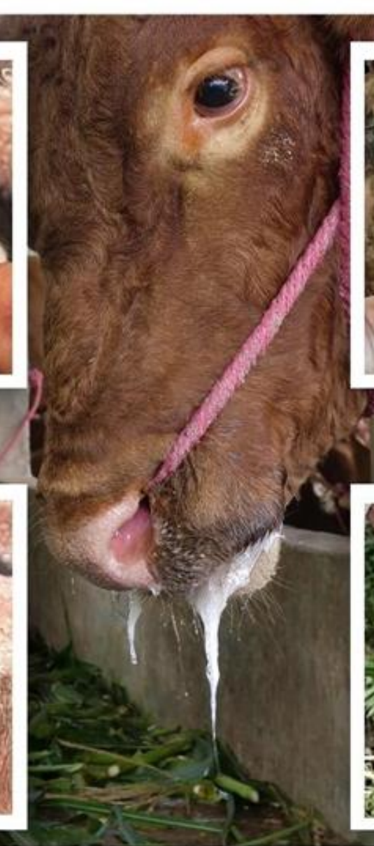
Keluar air liur berlebihan (Hipersalivasi)