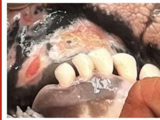
Lepuh/lesi pada gusi