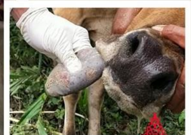
Lepuh/lesi pada lidah